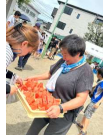
松本副実行委員長