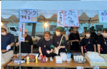
子ども会による模擬店