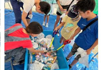
おもちゃのつかみ取り